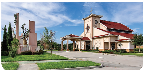
GIÁO XỨ ĐỨC MẸ LA VANG - WWW.LAVANGCHURCH.ORG